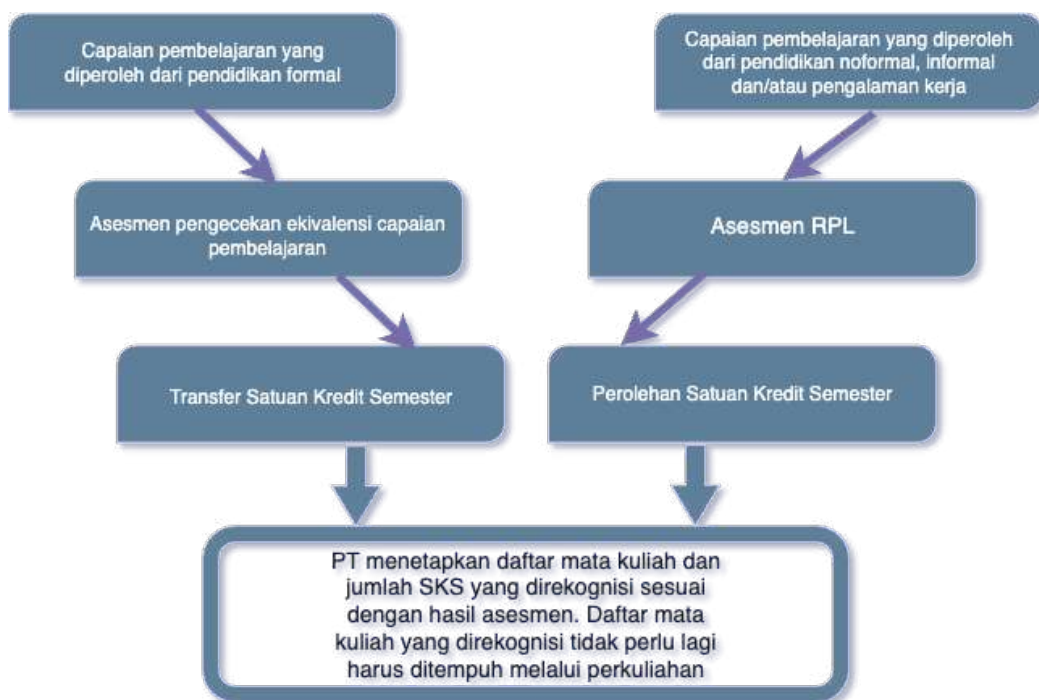
Gambar 5. skematis rekognisi dari capaian pembelajaran formal, nonformal, informal dan/atau pengalaman kerja

Mahasiswa yang telah diberikan pengakuan perolehan sks melalui RPL mengikuti pembelajaran dengan menempuh sisa mata kuliah dan jumlah sks sesuai dengan kurikulum dan capaian pembelajaran program studi. Batas maksimum sks yang dapat diakui dan lama studi yang harus ditempuh oleh mahasiswa yang diterima melalui RPL ditetapkan oleh pemimpin perguruan tinggi sesuai dengan ketentuan peraturan perundang-undangan, dengan ketentuan jumlah maksimal pengakuan capaian pembelajaran yang dapat diakui adalah 70% (tujuh puluh persen) dari total sks beban belajar suatu program studi.