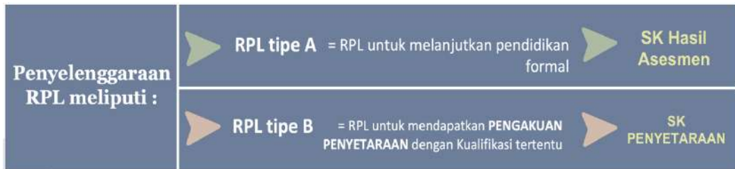
Gambar 1. Penyelenggaraan RPL pada UM Buton

RPL untuk melanjutkan pendidikan formal yang selanjutnya disebut sebagai RPL Tipe A dilakukan melalui pengakuan capaian pembelajaran secara parsial, yaitu pengakuan hasil belajar yang diperoleh dari: (1) program studi pada perguruan tinggi sebelumnya; (2). pendidikan nonformal atau informal; dan/atau (3). pengalaman kerja setelah lulus jenjang pendidikan menengah atau bentuk lain yang sederajat.